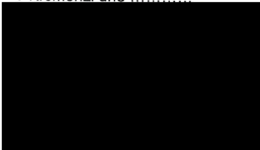
Mgr. Jaroslav Němec starosta města Kroměříž